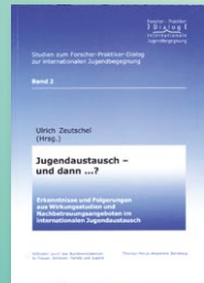
Ulrich Zentschel (Hrsg.) Jugendaustausch – und dann ...?