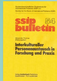
Alexander Thomas (Hrsg.) Interkultureller Personenaustausch in Forschung und Praxis