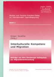
Gregor Taxacher (Hrsg.) Interkulturelle Kompetenz und Migration